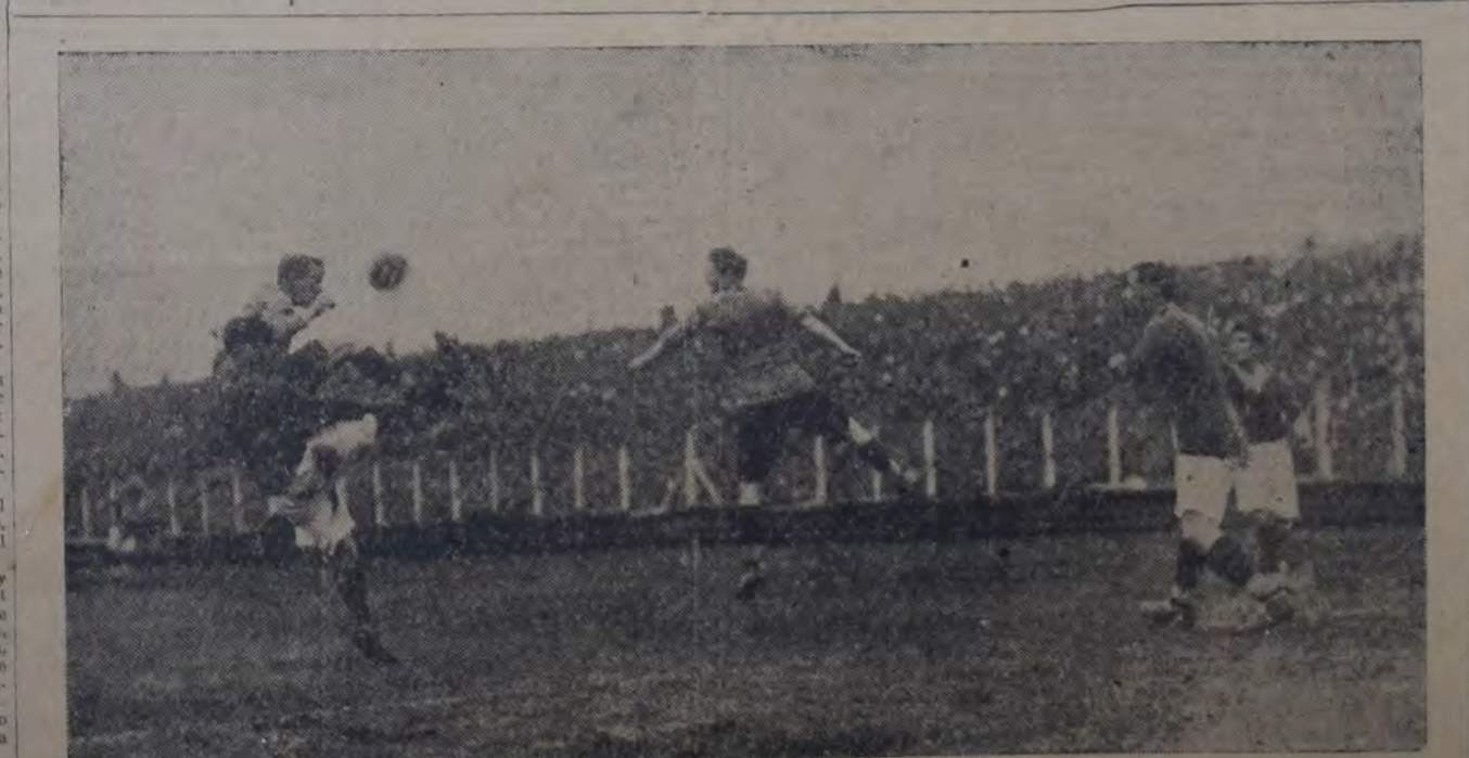
DURANTE LA PRIMERA ETAPA, LA DELANTERA DE BOCA JUNIORS DIÓ ABUNDANTE TRABAJO A LA DEFENSA DE SAN LORENZO, LA CUAL pese a sus esfuerzos, no pudo evitar que al finalizar los 45 minutos el score marcara dos tantos a uno en favor de los boquenses.