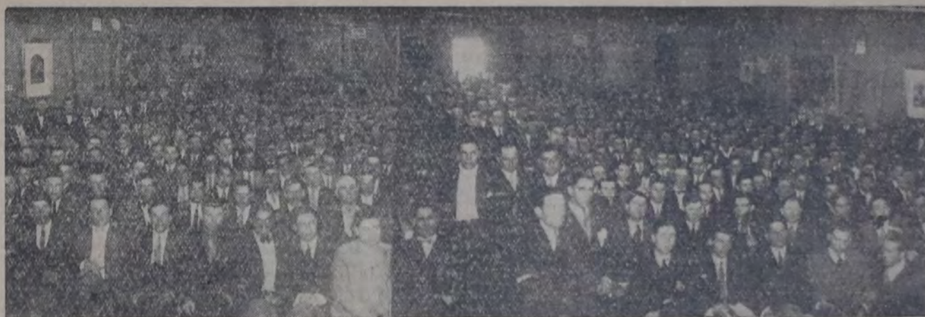
PARTE DE LOS ASAMBLEISTAS UBICADOS EN LA PLATEA

EN UNA ASAMBLEA POSTERIOR SERA COMPLETADO